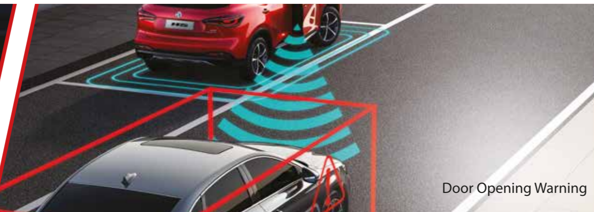
Door Opening Warning