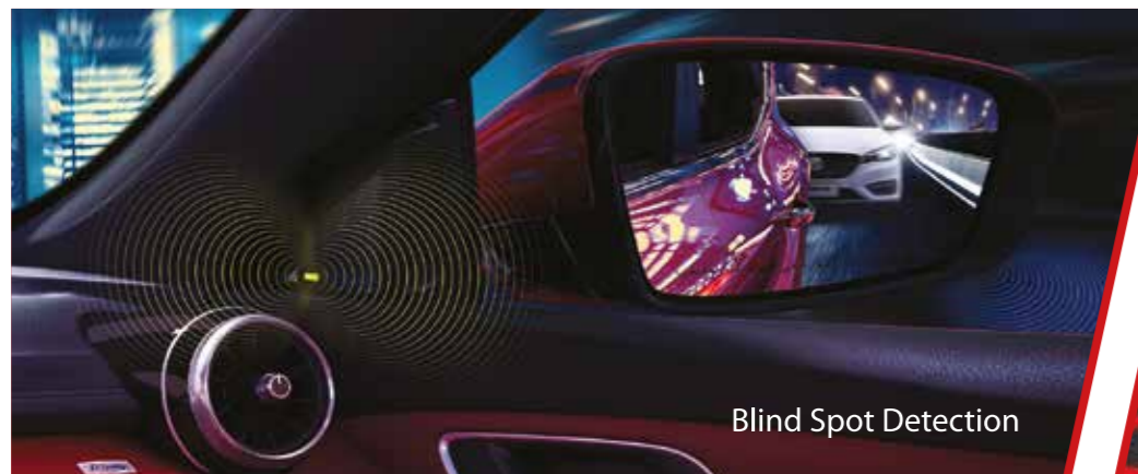
Blind Spot Detection